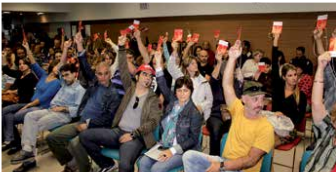
Salão Multicultural ficou lotado na assembleia geral

Em uma assembleia geral que lotou o Salão Multicultural da Ecosse de, dia 16/3, foram eleitos os 48 delegados do Sintrajufe/RS ao 8º Congresso Nacional da Fenajufe, que acontece de 26 a 30 de abril, em Belo Horizonte (MG). Pela quantidade expressiva de participantes, o sindicato enviará o número máximo de delegados determinado pela federação.