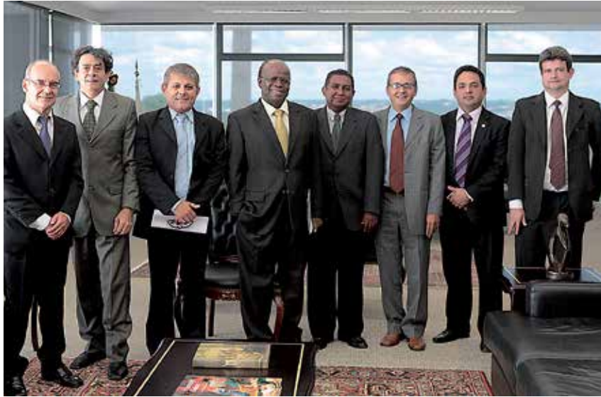
Fenajufe reuniu-se com ministro Joaquim Barbosa no início de março

O secretário de Recursos Humanos do STF, Amarildo Vieira de Oliveira, confirmou, dia 15/3, que o presidente do STF, ministro Joaquim Barbosa, autorizou o pagamento do reajuste da GAJ. Segundo Amarildo, o pagamento deve ser feito até 26/3, para todos os ramos da Justiça.