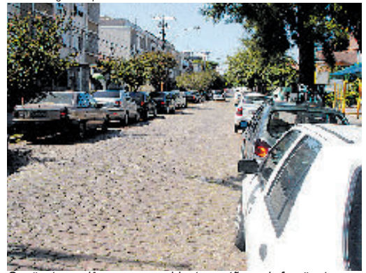
Seqüestros relâmpagos e acidentes estão mais frequentes

ocorrência. Cabe uma pergunta: se essas situações se configurarem como acidente de trabalho, o servidor não teria direito a apoio médico e até ressarcimento financeiro das despesas? “Esperamos melhor postura do tribunal e é importante registrar uma crítica aos legisladores, que não declararam formalmente a atividade de oficial de