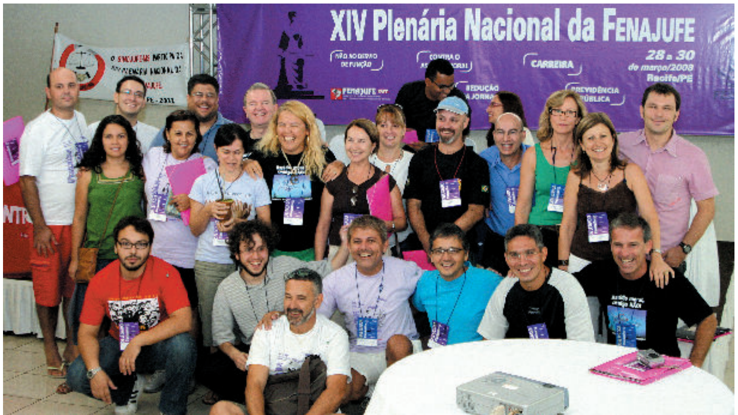
Delegação gaúcha no encerramento das atividades. Além da Plenária, houve encontros nacionais, em Recife, sobre comunicação e plano de carreira