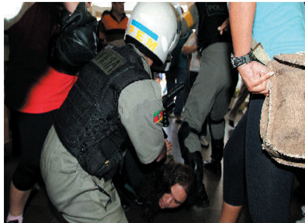
BM agride manifestantes que faziam protesto pacífico

foram provocados e instigados a reagir durante o trajeto entre o local da detenção e o Palácio da Polícia.