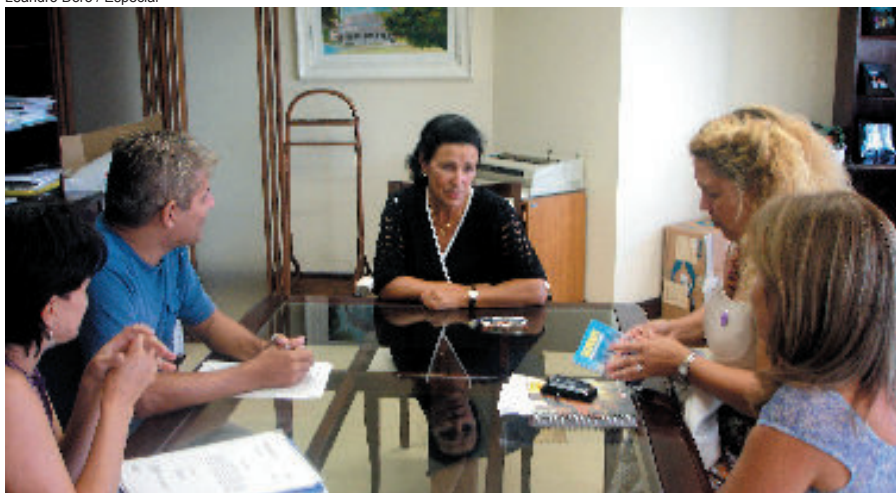
Diretores reapresentaram pauta de janeiro com reivindicações dos servidores da Justiça Federal