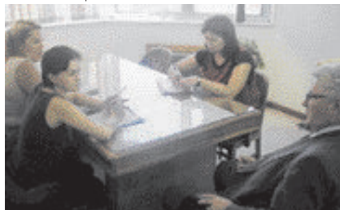
Meta do TRT é planificar as vagas