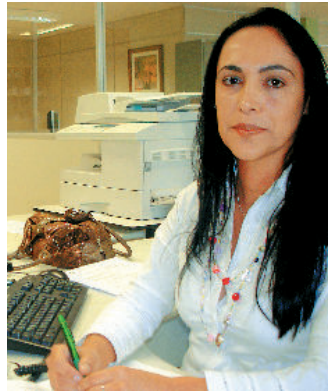
Helena teve o carro roubado