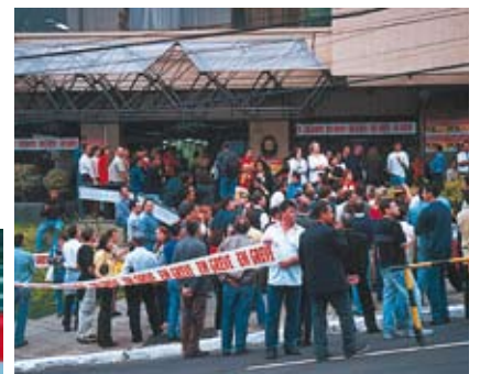
Acima, a greve de 2001, na antiga sede do TRF, na av. Mostardeiro