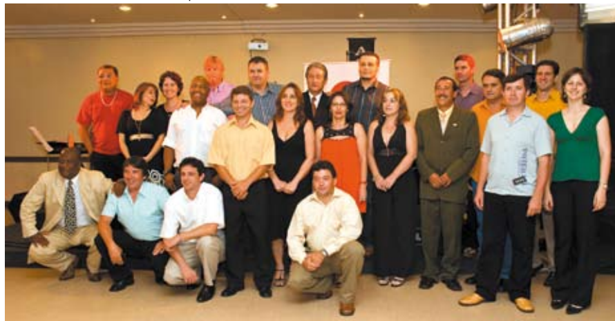
Posse aconteceu em dezembro; primeira reunião do Conselho Geral será em março