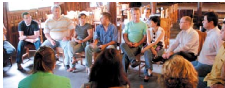
Diretores e assessoria jurídica falam sobre as ações do sindicato

receberam em torno de 41% dos valores pendentes e os aposentados, 37%.