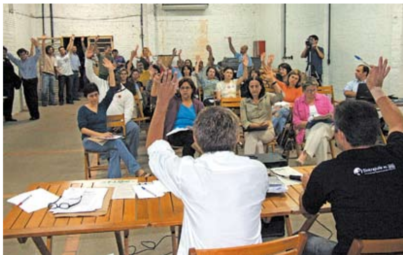
Plenário aprova prestação de contas do Sintrajufe

Os colegas da JT de PoA, em assembléia de base dia 19/11, aprovaram a proposta do Sintrajufe de que a parcela de 2008 (20% do impacto total) seja disponibilizada para provimento de 150 cargos (cerca de metade do número implementado em 2007 referente as duas primeiras parcelas), sendo 100 de técnicos e 50 de analistas (segundo a mesma proporção de 2007). A prioridade deve ser o primeiro grau. Como no início desse ano, a proposta do sindicato é baseada em estudo orçamentário que demonstrou ser viável a efetivação no próximo ano de todas as transformações de FC pendentes no primeiro grau, além da disponibilização de mais uma FC 02 em cada secretaria de VT como previsto na lei 11.436/06. No estudo, ainda se verificam sobras que possibilitam a implementação de FCs também no segundo grau. O Sintrajufe enviará um documento com as sugestões à presidência do tribunal. Antes, realiza reunião com a Amatra dia 26/11.