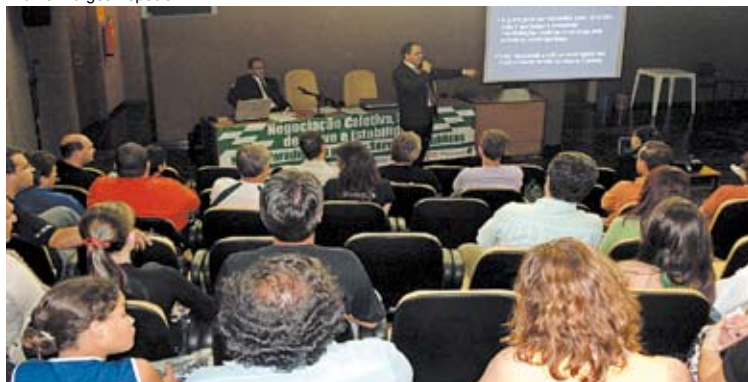
Seminário em Caxias reuniu colegas da região

ram com a orientação da fotógrafa Liliane Giordano. Na ocasião também foi lançada e a campanha Assédio moral, comigo não! , com a distribuição da cartilha elaborada pelo sindicato e da camiseta alusiva à campanha. O seminário, finalizado com um coquetel, foi filmado e suas imagens serão editadas em DVD para posterior divulgação.