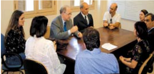
Diretores recebem nova administração do TRT

pelos servidores. Na ocasião, foi registrado também que o TRT foi o único tribunal a se fazer presente na posse da nova direção do Sintrajufe.