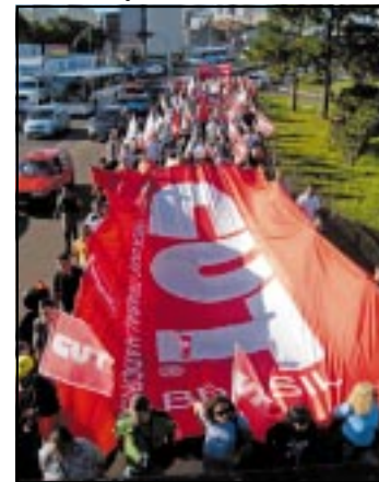
Ato reuniu centenas na Capital