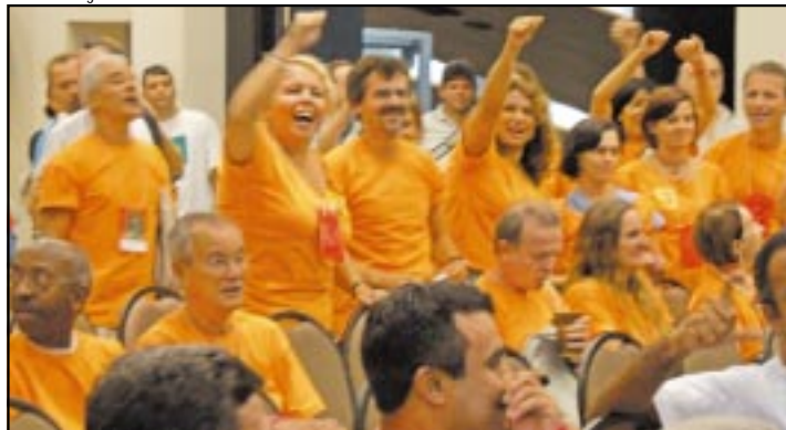
Plenário rejeitou “negociações” que restrinjam direitos