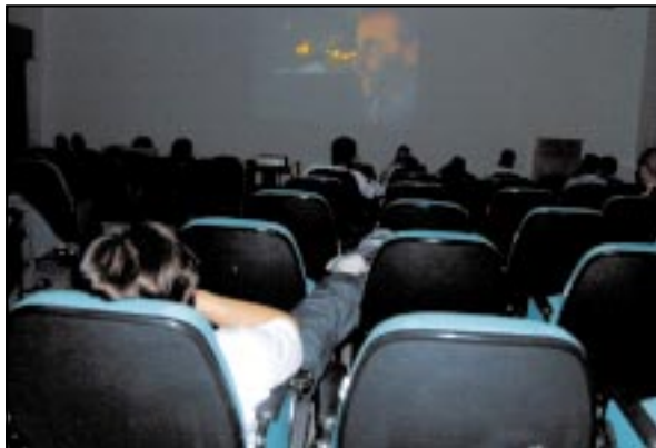
Curtas-metragens gaúchos tiveram sessões ao meio-dia