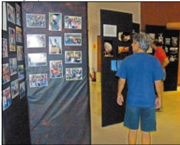
Fotos da greve, do calendário e do grupo 35mm foram expostas