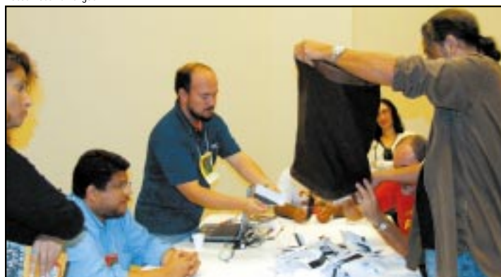
Comissão Eleitoral começou a apuração à 0h37min de 1º/4

Defendendo a manutenção da decisão da Comissão Eleitoral e o reconhecimento dos votos obtidos no processo de votação, a chapa 3 recorreu à Justiça. Ainda na manhã de domingo, foi concedida liminar na ação movida pelos representantes da chapa 3, a qual tem por objetivo que se cumpra o Regimento Eleitoral do congresso, mantendo-se os cálculos de proporcionalidade definidos antes da eleição