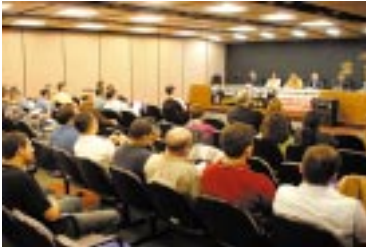
Os agentes durante 1º Encontro

Com o tema "Segurança Orgânica e Polícia Judicial", os agentes de segurança do judiciário federal gaúcho realizarão, dia 27/3, no Auditório da Varas Trabalhista de Porto Alegre, o seu II Encontro Estadual. As inscrições podem ser