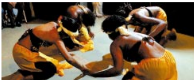
Grupo Omodua foi atração na última Sexta Básica de 2006

As Sextas Básicas enfocaram diversos temas: Dia Internacional da Mulher, Dia do Trabalhador do Orgulho GLBT e aniversário do Sintrajufe, que reuniu outras comemorações. Nessas datas, vários artistas de dança, artes cênicas, música e outras expressões artísticas mostraram seu trabalho.