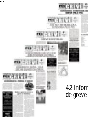
42 informativos de greve

Cartazes: 28 modelos Adesivos: 10 modelos Camisetas: 3 modelos Faixas: 16 modelos Apedidos publicados em jornal: 8 Banners: 2 modelos Cartilhas: 3