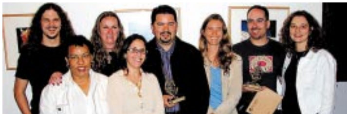
Premiação do Concurso Fotográfico aconteceu na Casa de Cultura Mario Quintana

O ano foi movimentado na agenda de cultura e lazer do Sintrajufe. As várias atividades abrangeram um grande número de sindicalizados, seus dependentes e a comunidade.