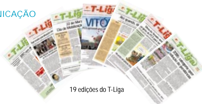
19 edições do T-Liga

Uma das grandes preocupações do Sintrajufe é que a categoria esteja bem informada. Isso sem prescindir da responsabilidade na checagem das notícias divulgadas nos veículos de comunicação da entidade.