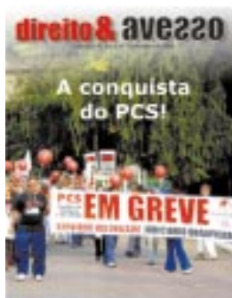
A revista Direito &amp; Avesso foi distribuída em novembro