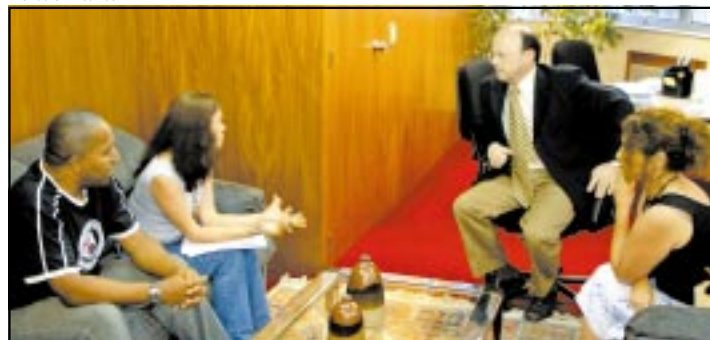
Diretores falaram sobre perseguição sofrida por colegas grevistas