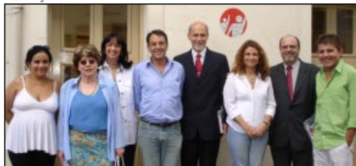
Juízes, na foto com diretores do sindicato, assumem dia 15/12