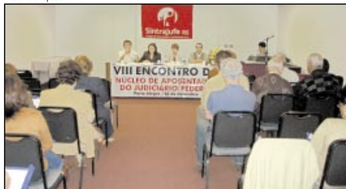
Questões específicas, saúde e conjuntura foram temas abordados