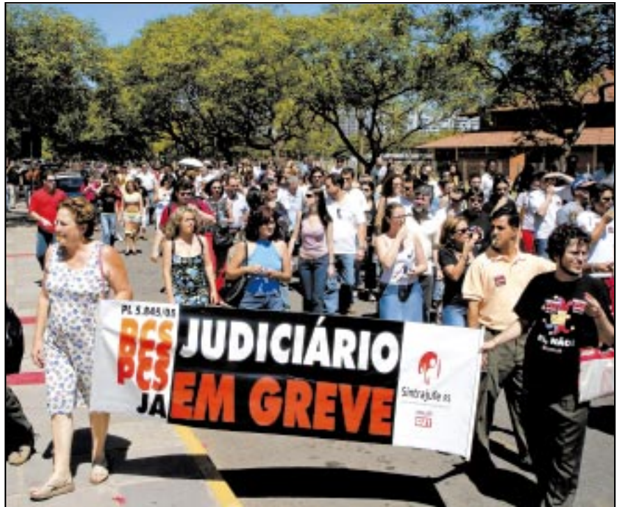
Dia 29, colegas fizeram uma caminhada em frente à JF: toda a pressão sobre o CNJ