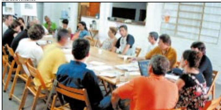
Diretorias colegiada e de base fazem parte do Conselho Geral