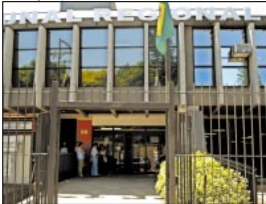
Cargos devem ser ocupados pelos concursados

permeada por animosidades, em diversos graus, e provocações diurnas.