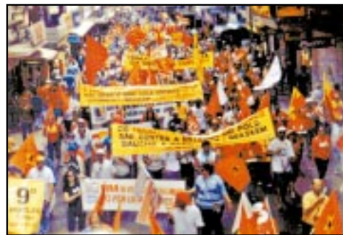
Mais de 3 mil pessoas nas ruas de Porto Alegre