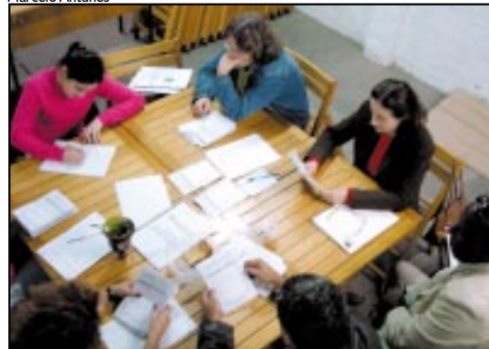
Conselho Fiscal participou do escrutínio dos votos

seguiram fazer eleições, será tema da primeira reunião do Conselho Geral, que terá a participação dos diretores de base recém-eleitos.