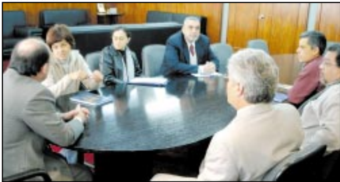
Washington (C), especialista em orçamento, também estava presente