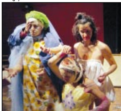
Peça tem linguagem calcada no trabalho do ator

o espectador com a literatura insana, com papéis e personagens multifacetados, com fichários e portas que