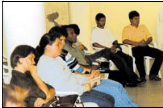
Perseguição à atividade sindical foi a tônica dos depoimentos