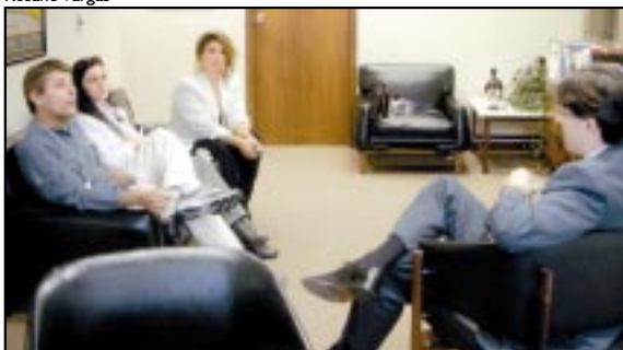
Diretor (D) disse que pagamentos serão feitos administrativamente