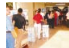
...que se estendeu para além da calçada do prédio

O retorno ao trabalho após o feriado de Páscoa dos servidores do Protocolo das VTS em Porto Alegre foi complicado. Se a média diária de documentos entregues é de cerca de 2,2 mil, na segunda-feira, 28, ela foi de 5 mil documentos. A partir de reclamações de advogados e de alguns servidores, o sindicato esteve no local e constatou a enorme fila que chegava até a calçada fora do prédio.