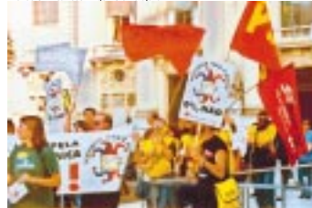
Resolução do CJF é um ataque aos trabalhadores

A Reunião Ampliada da Fenajufe, realizada no dia 14 de março de 2005, em Brasília, aprovou, por unanimidade, MOÇÃO DE REPÚDIO ao Conselho da Justiça Federal, que exorbitando as suas atribuições legais, ataca o direito de organização e de greve dos