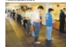
A volta do feriado foi marcado por fila no Protocolo.....