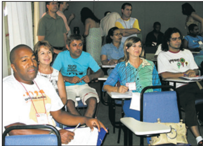
Delegação do Sintrajufe levou posição tirada pela categoria em assembléia