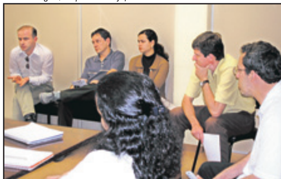
Colegas fizeram várias reuniões com o sindicato em 2004

bém às salas de audiência, a fim de melhorar a qualidade do ambiente de trabalho.