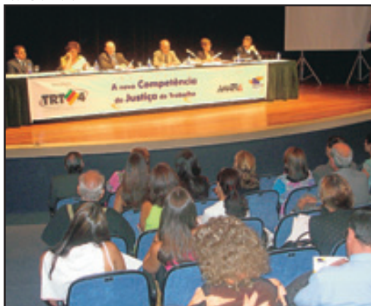
TRT promoveu seminário sobre o tema