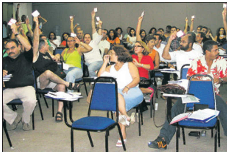
Representantes de 21 estados estavam presentes

servidores do Judiciário Federal. Estavam presentes 95 delegados de 21 estados.