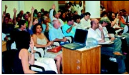
Fechamento da equipe de vigilância em saúde do trabalhador gera protesto

desenvolvimento desse serviço foram buscados recursos junto ao governo federal, que totalizaram R$ 1 milhão até o final de 2004. Os recursos são oriundos do Fundo Nacional de Saúde.