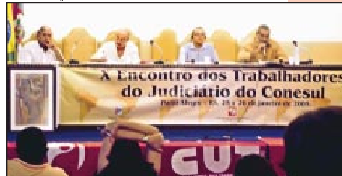
Nos debates, foi defendida a união dos trabalhadores do Cone Sul