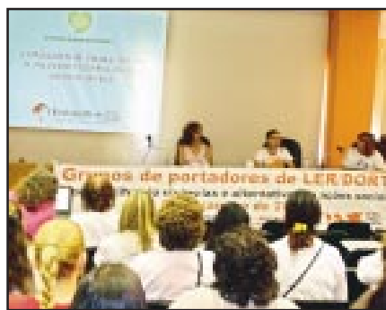
Sintrajufe mostrou alguns casos