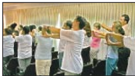
Participantes fizeram alongamento