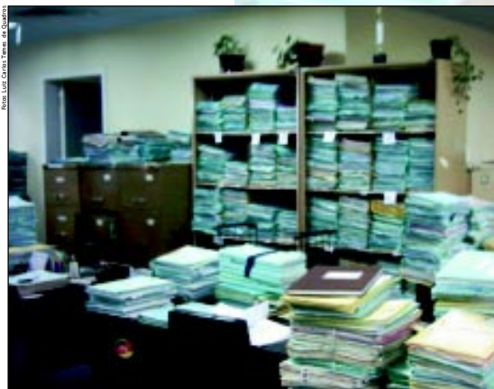
... para dar andamento aos mais de 9 mil processos envolvendo os 22 municípios da comarca