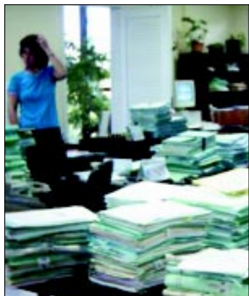
Em Santa Cruz, são 22 servidores distribuídos em duas Varas Trabalhistas...

* Servidor lotado na JT de Santa Cruz do Sul e diretor de base