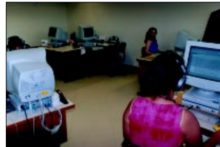
Setor de Taquigrafia: ajuda mútua e rodízio para minimizar problemas